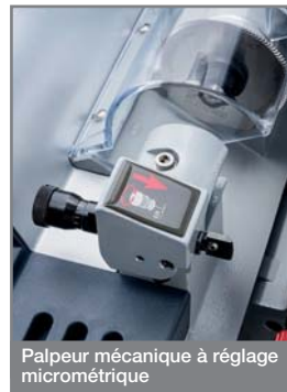
Palpeur mécanique à réglage micrométrique

La machine est dotée d'un palpeur mécanique à réglage centésimal grâce à une bague micrométrique (+/- 0,05 mm).