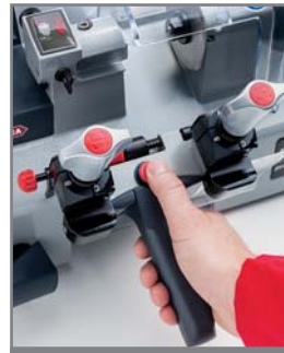
On détèle le chariot en appuyant sur un bouton dédié