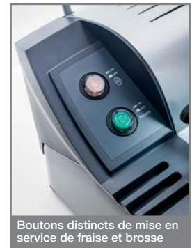
Boutons distincts de mise en service de fraise et brosse

L'interrupteur magnétothermique garantit une sécurité maximum à l'opérateur. En cas de panne de courant, il faut rallumer la machine manuellement. On ne détèlera le chariot qu'après avoir abaissé les calibres pour éviter toute rupture accidentelle.